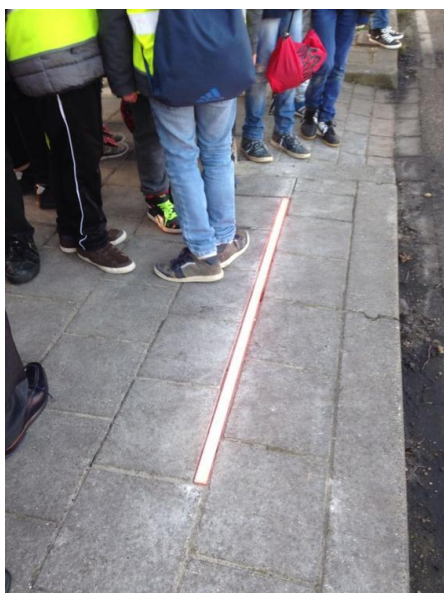
“Oversteken met laser”